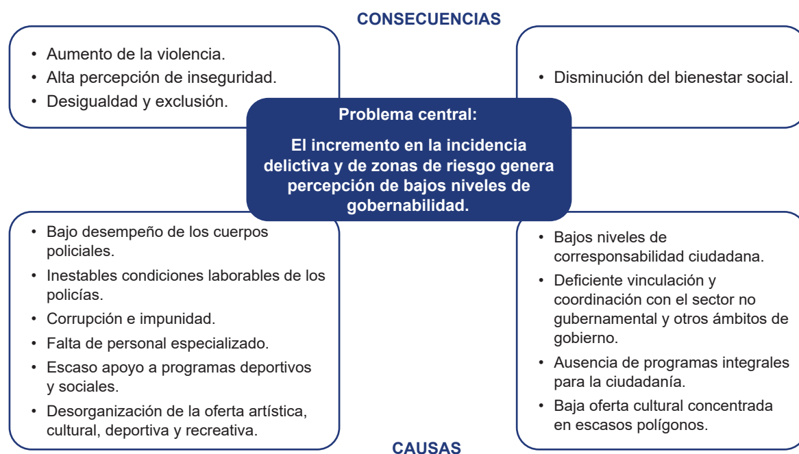
Figura 1. Árbol de Problemas Eje 1. Municipio Seguro