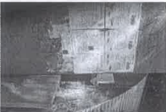
Condiciones físicas que muestra el apoyo oriente (grafiti, propaganda y suciedad impregnada). Del nivel 0.100m a los 2.00m

3. En el anuncio autosoportado ANU202000241, se observó que soporte oriente en tramo de 2.00m de altura, presenta grafiti y suciedad, lo que infiere falta de mantenimiento en el área señalada, dicha condición contraviene lo establecido en los artículos 93 fracción I numeral 2 del inciso "c", 101, 102, 112 fracción V inciso e, 121 fracción III, VI y XV del "REGLAMENTO".