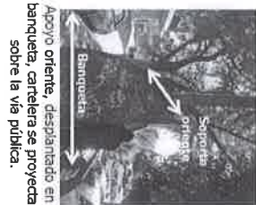
Apoyo oriente, desplazado en banqueta, canteleira se proyecta sobre la vía pública.