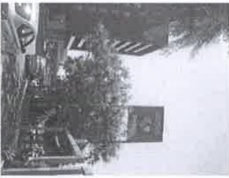
Se observa que parte de la carátula (1.18m), está desplazado sobre la banqueta.