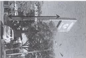
De nivel de banqueta al nivel de pavimento de plaza es 1.15m. El apoyo poniente de la placa al lecho bajo de la carátula es de 10.82m