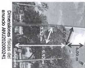
Dimensiones físicas del anuncio ANU202000241