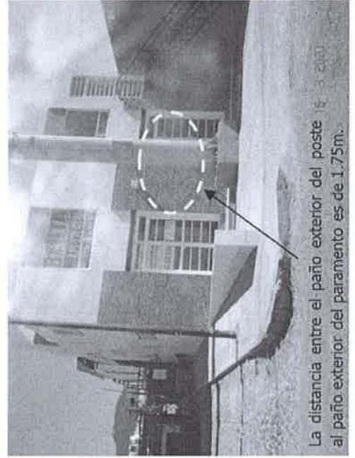
La distancia entre el paño exterior del poste al paño exterior del paramento es de 1.75m.

Derivado de la visita de obra realizada el 16 de marzo de 2021, se detectó que el anuncio auto soportado de propaganda doble cara No. ANU202001139, ubicado en Libramiento Sur Poniente No. 570, Campestre Italiana, Del. Josefa Vergara y Hernández, se encuentra cercano a una edificación sin la separación mínima de 3.00m entre el paño exterior de poste al paño exterior del paramento, ya que se obtiene la dimensión entre el paño exterior del soporte del anuncio y al paño exterior del muro siendo de 1.75m, así como también que existen cables eléctricos aéreos cercanos.