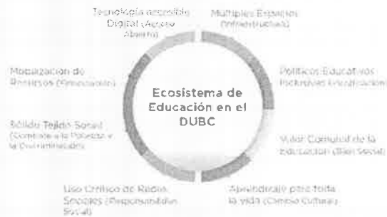
Figura B. Ecosistema de educación en el Distrito de Innovación de la ZMQ.